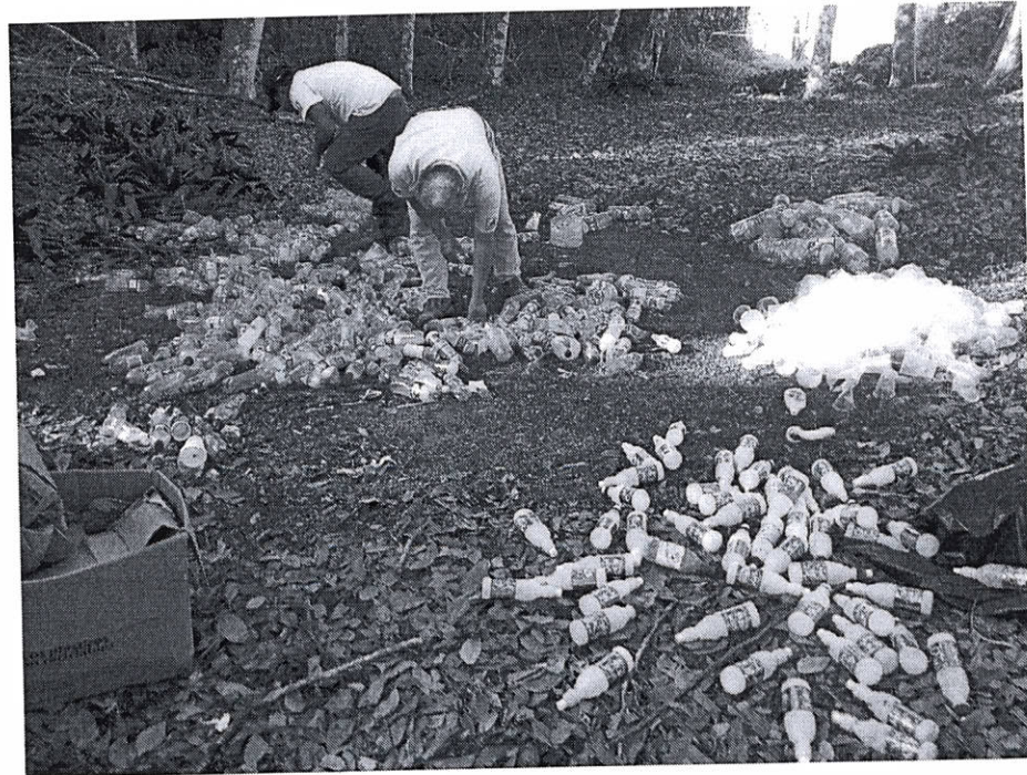
Fig.3: Clasificación de residuos en el día del agua 2019

Se rotularán de manera gráfica las estaciones de separación de residuos por medio de dibujos de los tipos de residuos que deben colocarse en cada contenedor, con el fin de facilitar la comprensión por parte de los visitantes y facilitar su manejo y disposición final.