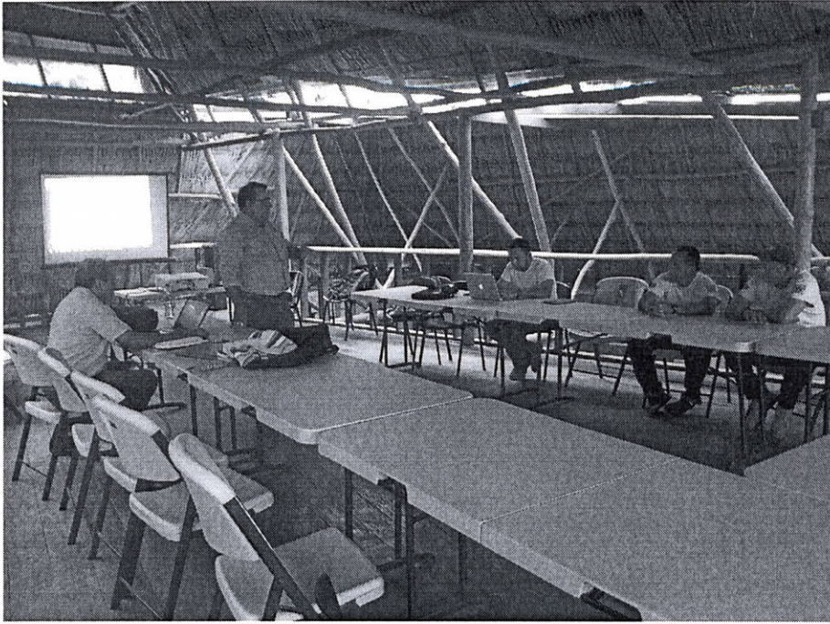
Fig.6: Reunión sobre el uso público del PNYNN.

Se participó en una reunión con personal del Sistema Guatemalteco de Áreas Protegidas de CONAP y del PYNM de la Dirección General del Patrimonio Cultural y Natural para estimar el cumplimiento en la ejecución del Plan de Uso Público 2003 – 2008 y las acciones que se deben tomar para la actualización y aprobación de este plan.